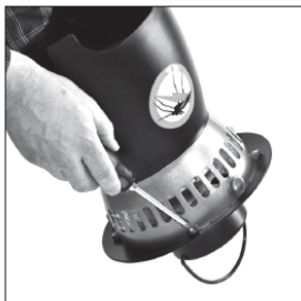
Open up the hat (4 x phillips screws).