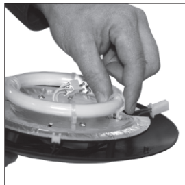
Disconnect 4 x tube holders (finch and turn gently inwards). Snap off the tube holders and attach them to the new tube.