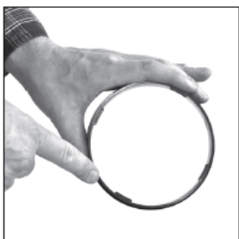
Quick lock adapter. Note position of the bayonette fittings.