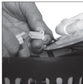
Disconnect the wires (fan and switch connector).